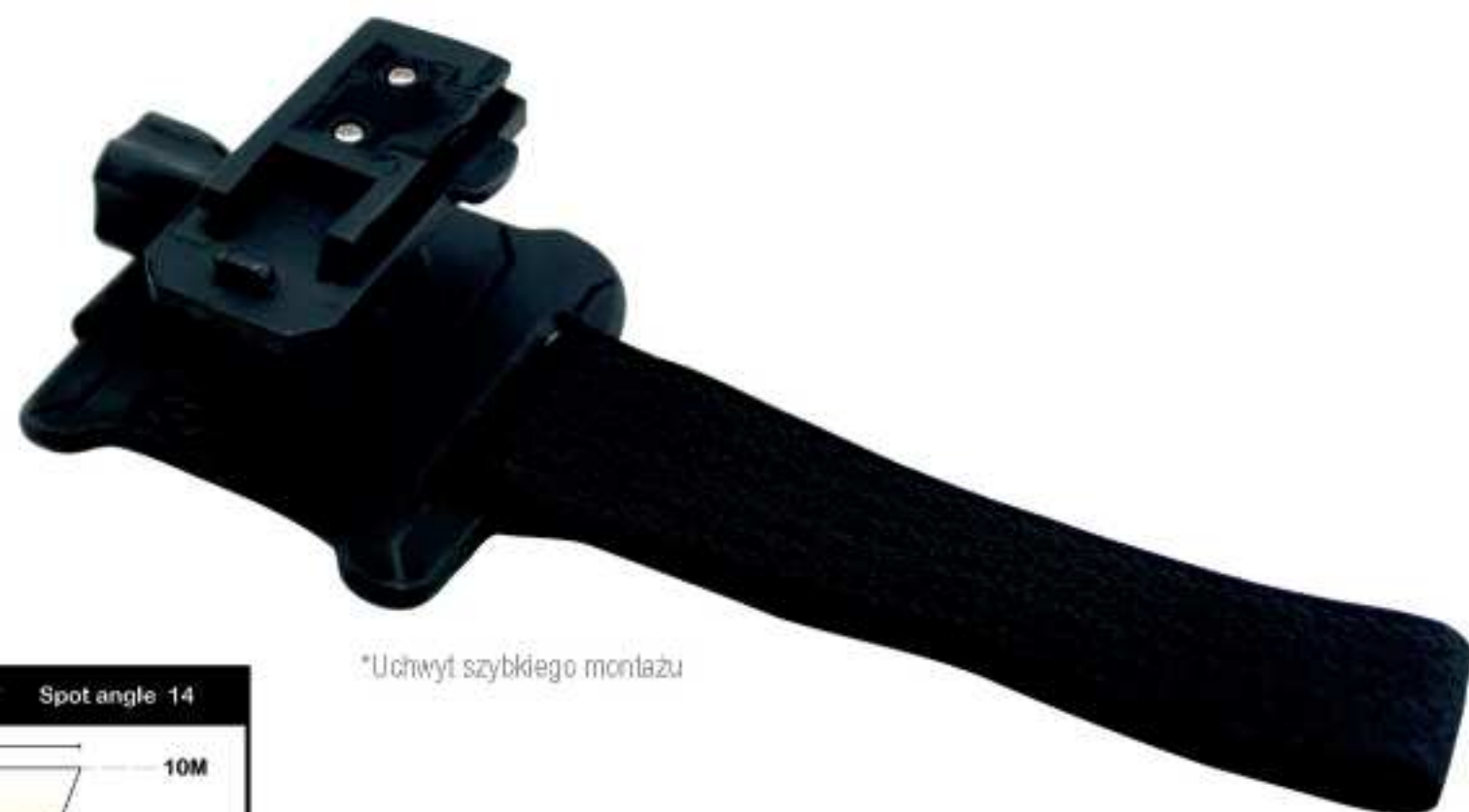
*Uchwyt szybkiego montażu