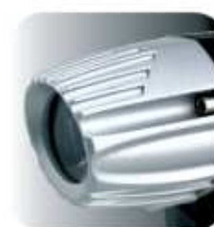
PD. CODE: XP-300C1