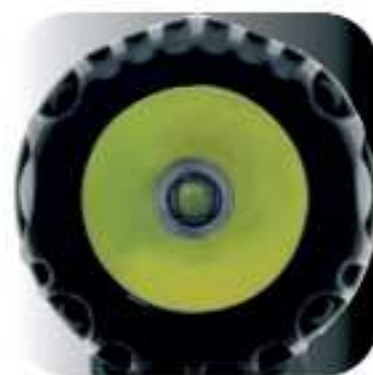
CREE XP-G (R5) Led