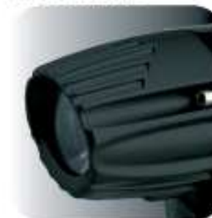
PD. CODE: XP-300C2