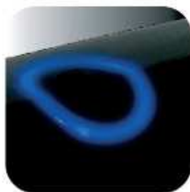
Wskaźnik stanu i ładowania akumulatora