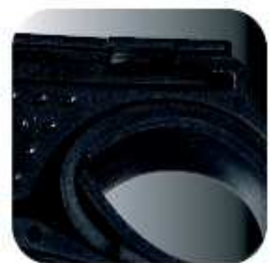
Uchwyt montażu na kierownicy (22-31,8 mm)