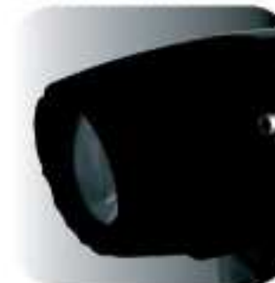
PD. CODE: XP-300C3