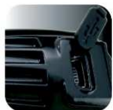
Gniazdo ładowania USB